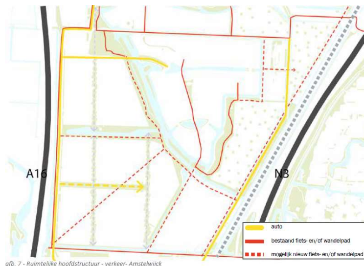
afb. 7 - Ruimtelijke hoofdstructuur - verkeer - Amstelwijk

Het bestemmingsplan is een uitwerking van een gezonde nieuwe woonwijk waar groen en blauw centraal staan. Eén van de uitgangspunten was het behouden van zoveel mogelijk groen en water. Dit is vertaald in een 40% groenblauwe eis en de eis dat 1 van de oevers van watergangen openbaar toegankelijk moet zijn. Inzet is een gezonde wijk met ruimte voor spelen en bewegen. Wandelaars en fietsers krijgen voorrang boven auto's. Er is een fijnmazig langzaamverkeersnetwerk en een strenge parkeereis opgenomen.